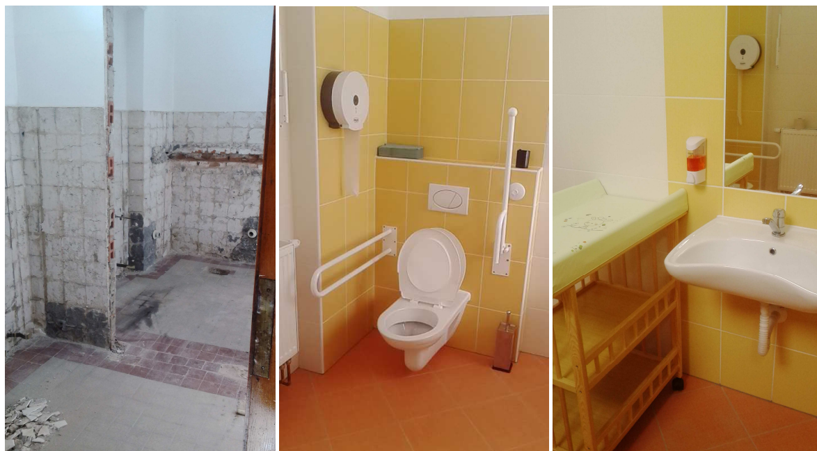
Rekonstrukce sociálního zázemí v 1. patře MKS

Významná investice proběhla v souvislosti s odstraněním havarijního stavu výtahu vedoucího do sklepa kavárny.