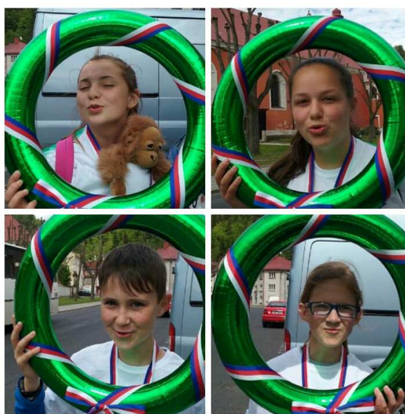
Čteme 24 hodin; Tým knihovny v soutěži „Souboj národů“