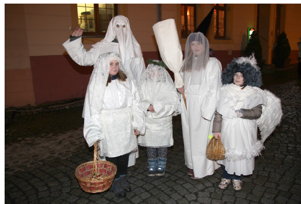
1. ročník Countryády Karlovarského kraje, Předvánoční setkání v Pluhově ulici