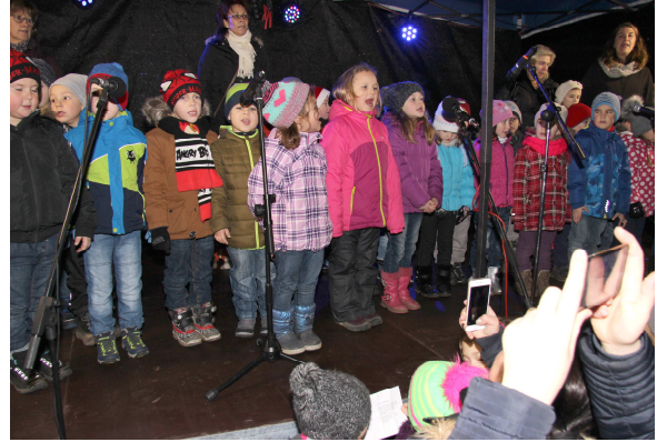
Pěvecký sbor Cubitus na akci „Slavnosti patrona města sv. Jiří“, Zpívání u vánočního stromu