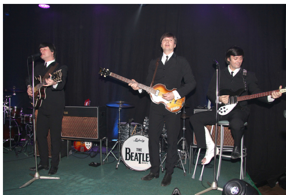
Maškarní ples pro děti; The Beatles revival na 14. Reprezentačním plese města Horní Slavkov