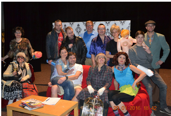
Vlevo: Pohádkové léto a Divadlo z bedny