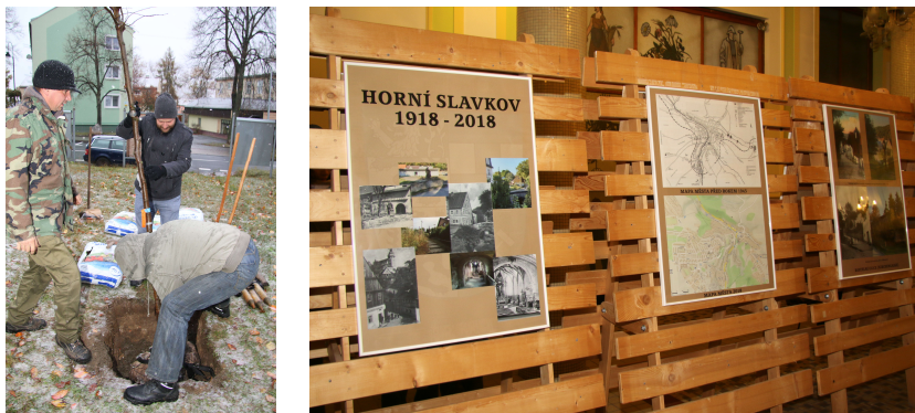
Slavnostní zasazení lípy k 100. výročí založení republiky, výstava „Horní Slavkov ve 100 letech“

Rok 2018 byl ve znamení oslav 100. výročí založení republiky. Ani MKS nezapomnělo a uspořádalo několik akcí k připomenutí této události (výstava, sázení stromu svobody, koncert).