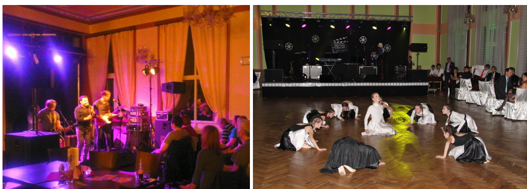
Koncert na kavárně LIWID; Reprezentační ples města

MKS bylo pořadatelem 7 hudebních či tanečních akcí. Konkrétně 2x proběhla diskotéka, 3x koncert, 1x ples a 1x maškarní ples pro děti. Na vstupném se utrážilo 62 050,- Kč.